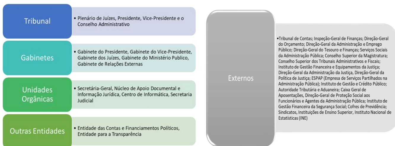
Esquema 1 Clientes/partes interessadas do DAF